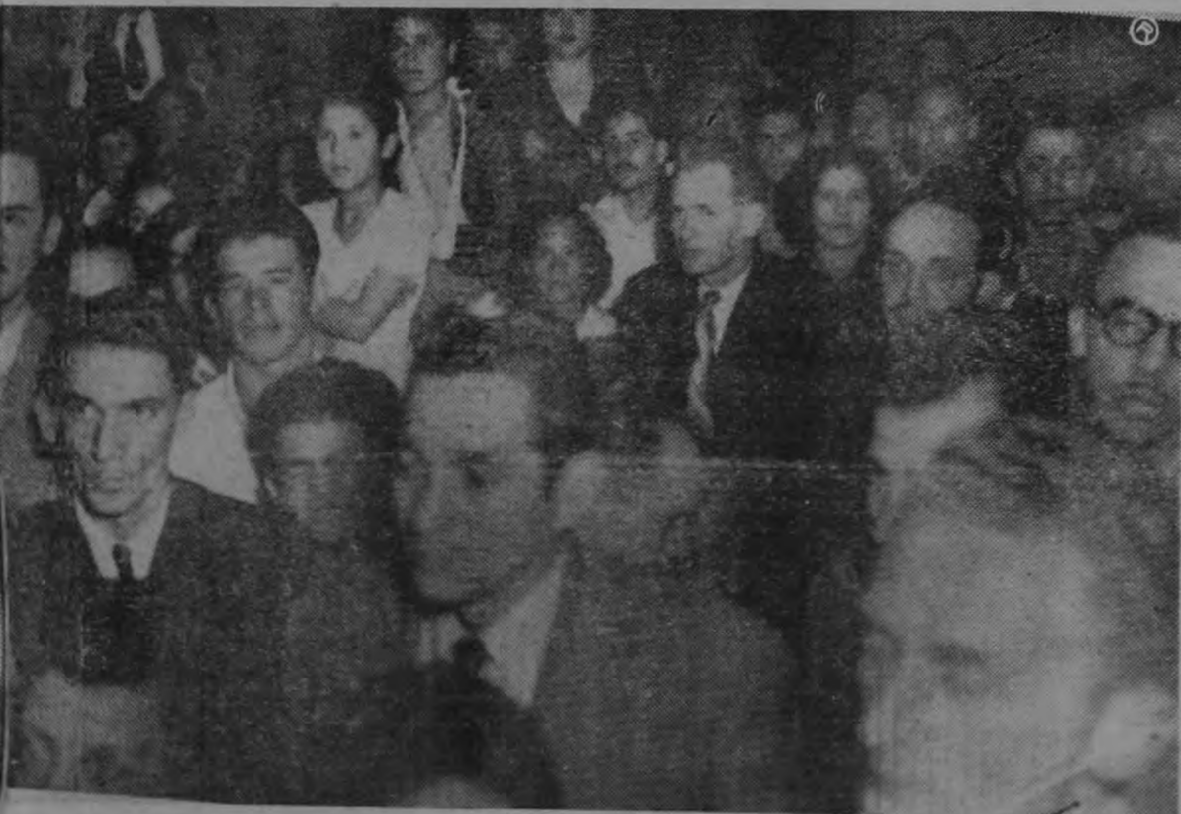
altos del Club Figuerista del Barrio México.

...Después de la intervención de don Pepe, el líder obrero ...Luis Alberto Monge, pronunció un brillantísimo discurso.