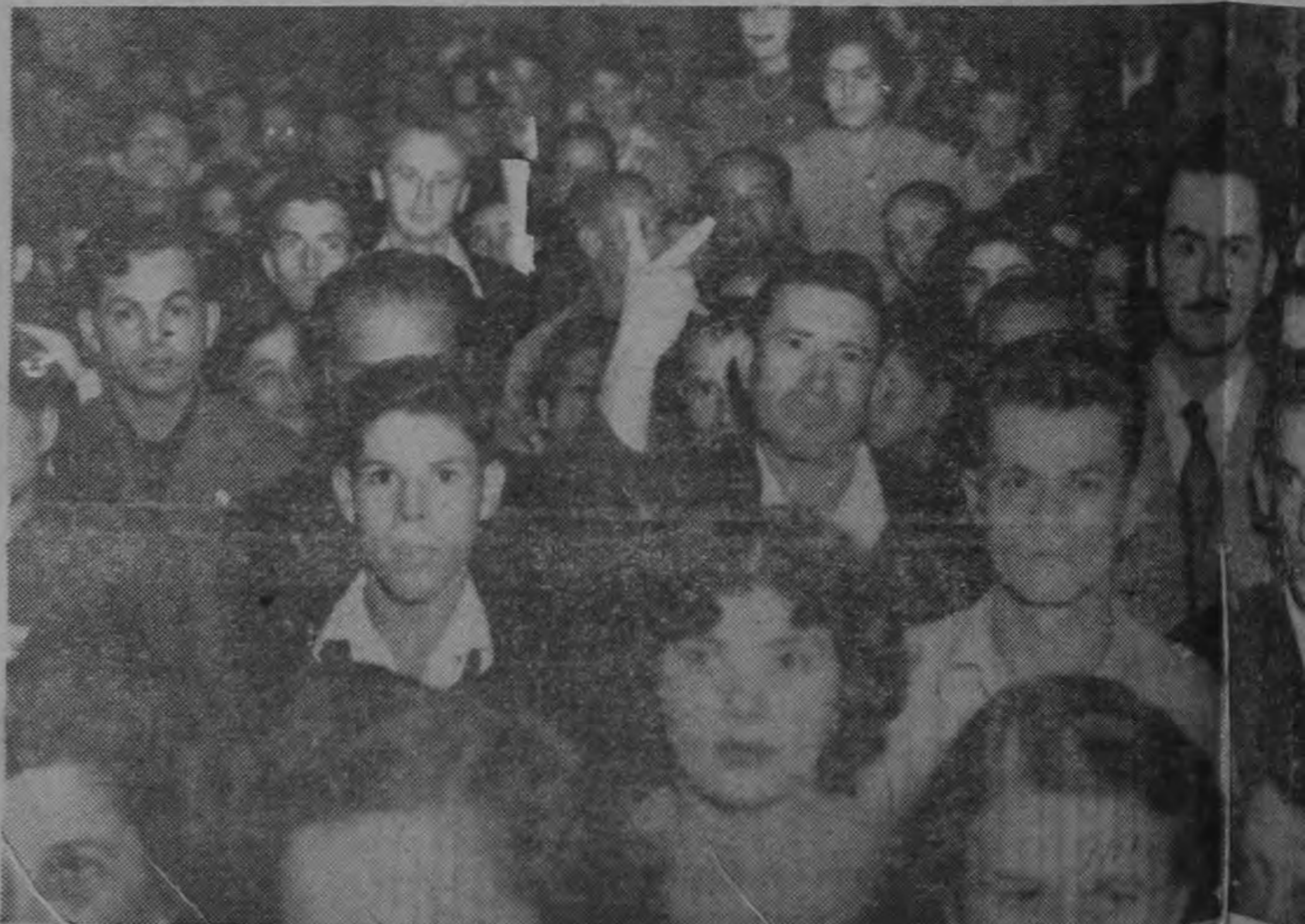
Vista parcial de la multitud que se aglomeró en los altos d