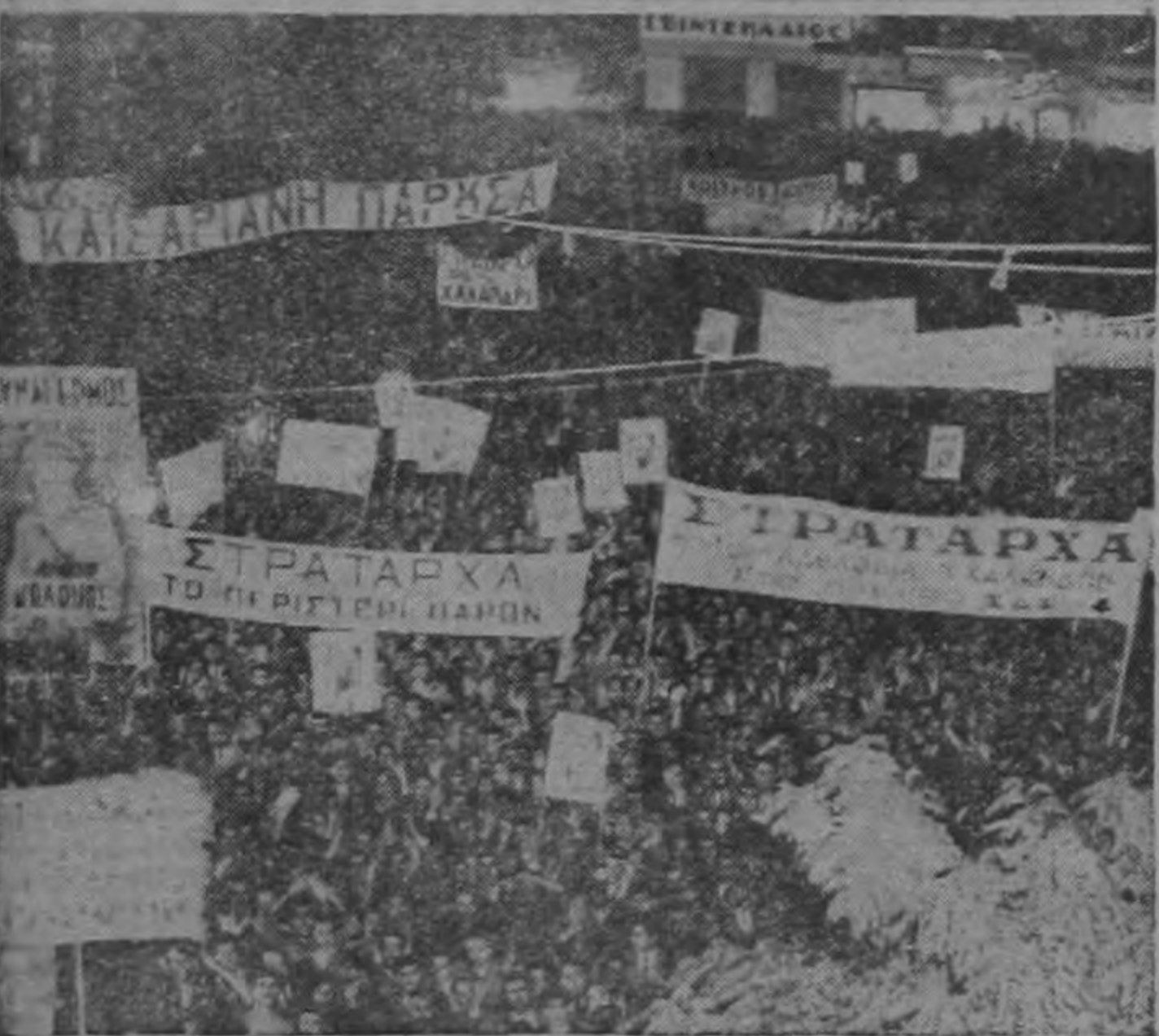
El Mariscal Alexander Papagos (arriba), líder del Partido de la Reunión Griega, aparece depositando su voto en las elecciones nacionales. Como resultado de la arrolladora victoria de su partido, ese líder conservador fué llamado por el Rey Pablo que le pidió que formase Gobierno. Papagos prometió acabar con la corrupción y cooperar con la Organización del Tratado del Atlántico del Norte a fin de reforzar las defensas en contra del comunismo. Abajo se ve parte del mar humano que se congregó bajo el balcón desde el cual Papagos se dirigió al pueblo de Atenas por la última vez antes de la elección. El resultado final dió a la Reunión 238 de los 300 asientos de la Cámara. Los comunistas que en la última Cámara tenían 10 asientos, esta vez no conquistaron ninguno.