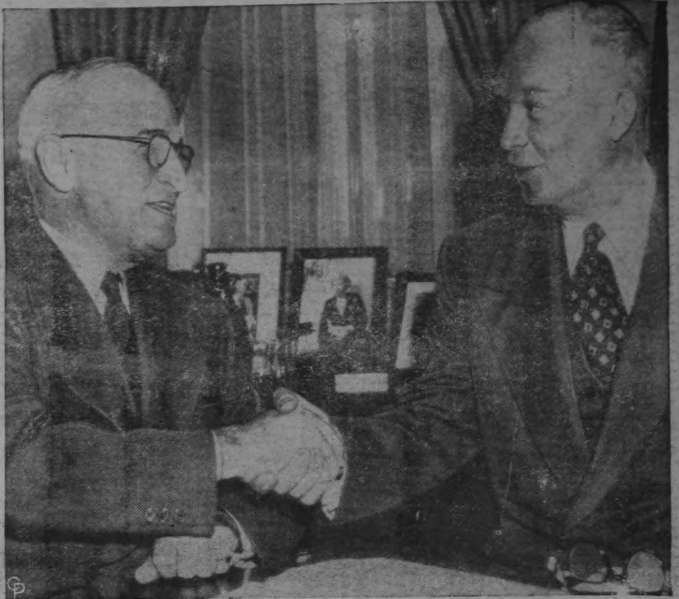
Amistosas sonrisas intercambian el Presidente Harry S. Truman y el Presidente Electo Dwight Eisenhower al reunirse en la oficina del Jefe del Ejecutivo en la Casa Blanca para su histórica reunión sobre el cambio de dirección. Más tarde se trasladaron a la Sala del Gabinete para una discusión en amplia escala de los asuntos urgentes de Estado.