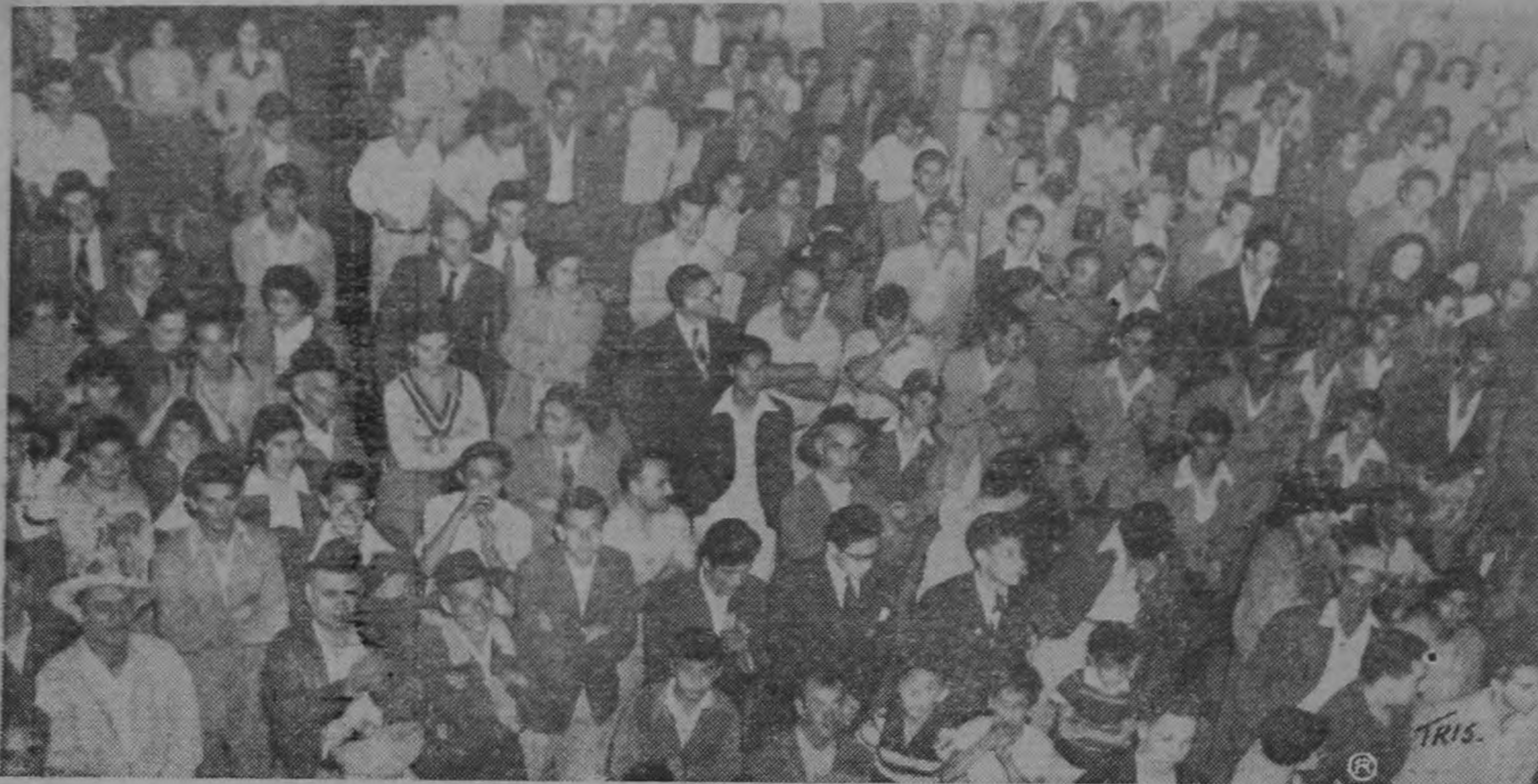
La gente que no cupo en el local se estacionó en la calle para oír al caudillo

El miércoles en la noche, precisamente, la noche en que se conoció el retiro de los candidatos Castro Cervantes y Echandi Jiménez, los vecinos de Barrio México aclamaron al ya Presidente Electo de Costa Rica don José Figueres. El fervorismo se ha extendido en tal forma en la ciudad capital, que se ha visto precisado a abrir clubes en casi todos los barrios de San José. Uno de los más populosos, Barrio México, demostró el miércoles en la noche que se ha sumado fervorosamente a la cruzada cívica figuerista.