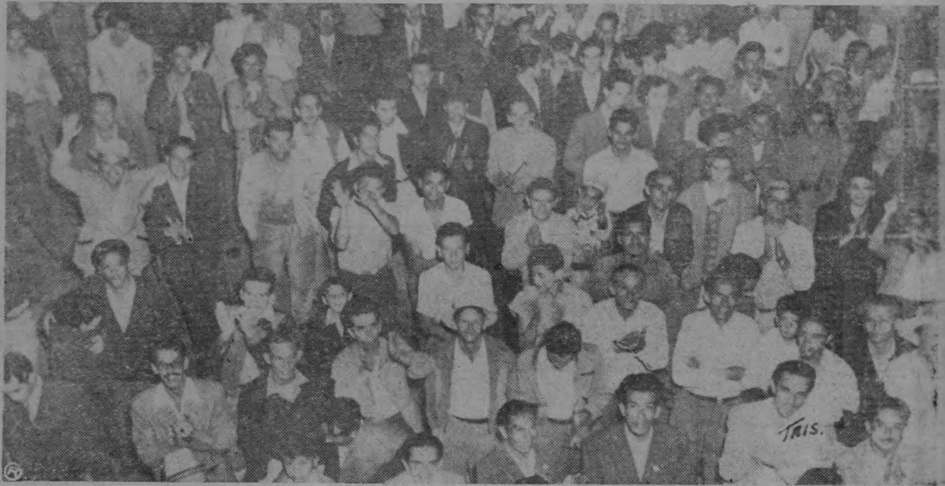
Otro aspecto de la muchedumbre en la calle

...nando Fournier habló también en ...abras hemos hecho la siguiente re-